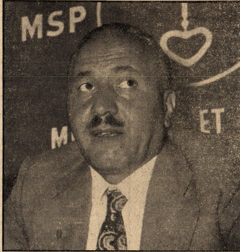
İşçilere ahlâk dersi vermek gerektiğini söyleyen Necmettin Erbakan