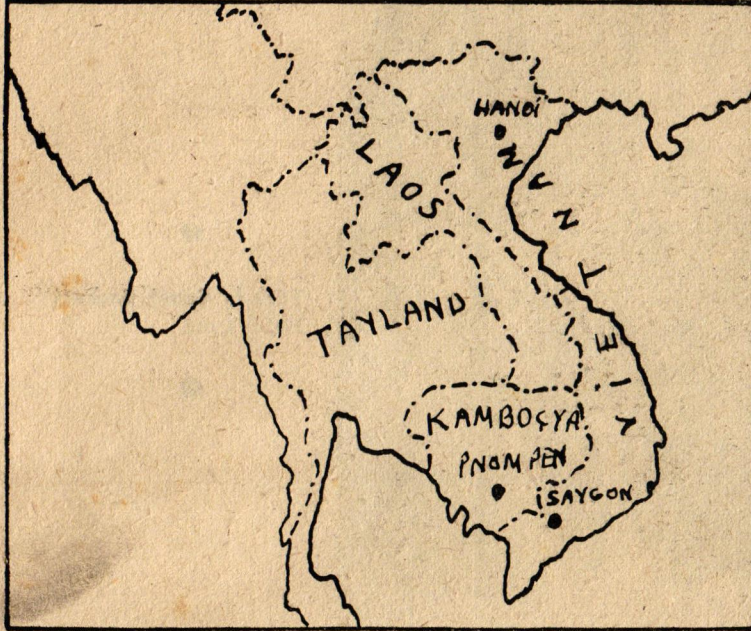
Haritada Kamboçya ve Vietnamın bulunduğu Hindičini bölgesi görülmüyor.

Çin hindindeki iktidar değişiklikleri üç nedene dayanıyor