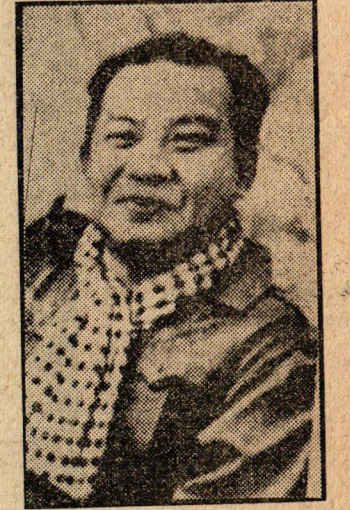
1970 yılında bir darbe ile devrilen ve geçtiğimiz hafta yeniden devlet başkanlığına getirilen prens Sihanuk.

Kamboçya savaşı, Ulusal Kurtuluş Kuvvetlerinin başarısıyla sona erdi. Vietnam'da da savaş, yine Ulusal Kurtuluş Kuv-